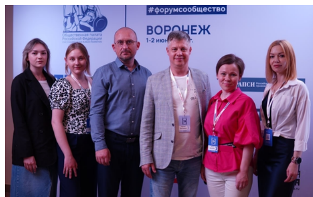
Форум «Сообщество» г.Воронеж

Наша команда растет и развивается! В этом году мы учились и посещали форумные кампании и сами выступали в качестве экспертов. Так, мы регулярно были участниками мероприятий, проводимых Агентством социальной информации, проходили обучение в Центре «Грани», Фонде президентских грантов, Агентстве стратегических инициатив и др.