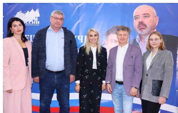
Форум отцов новых территорий ВОД «Отцы России» в Крыму