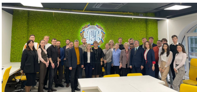
Международная научно-практическая конференция «Актуальные проблемы предпринимательства в торговле в условиях цифровой экономики» в РЭУ им. Плеханова